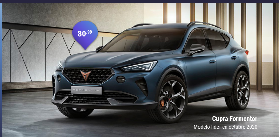
Cupra Formentor Modelo líder en octubre 2020

GEOM INDEX THE AUTOMOTIVE KNOWLEDGE DATABASE