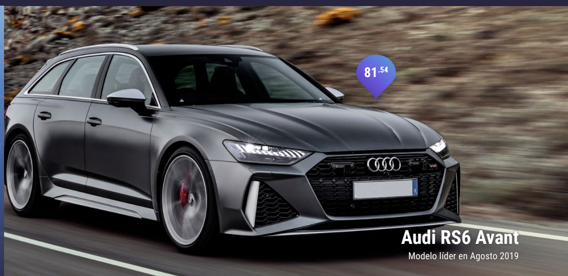
Audi RS6 Avant Modelo líder en Agosto 2019

GEOM INDEX THE AUTOMOTIVE KNOWLEDGE DATABASE